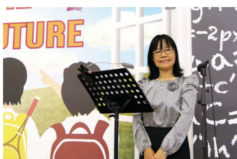
在「登陸」前一日最後一次早會分享