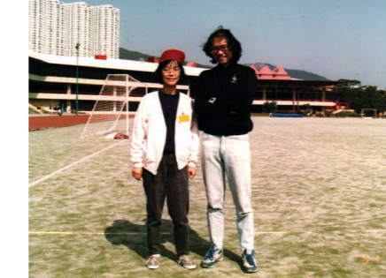
年輕時與瘦版趙Sir合照