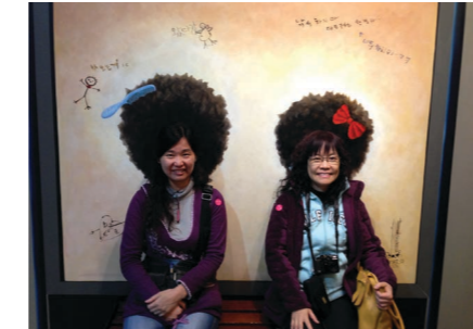
生物科爆炸頭仔寶