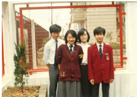
84年與學生植樹後留影