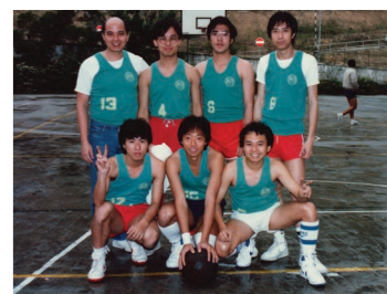
早年沐恩冠軍教師籃球隊