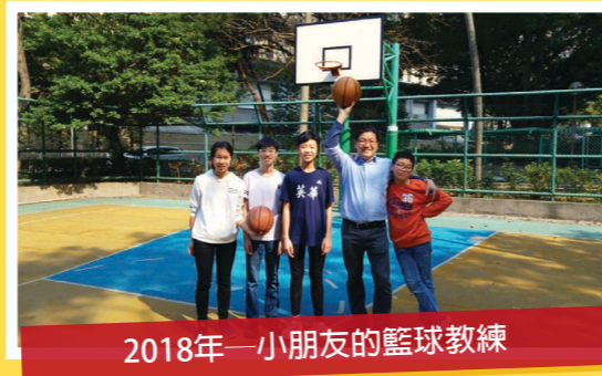
2018年—小朋友的籃球教練