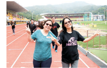
南亞路德會沐恩中學 二〇〇四至〇五年度中七生物科同學暨師長合照