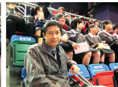
2017年陸運會與孔副校及學生合照