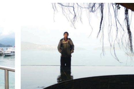
攝於香港中文大學新亞書院「合一亭」