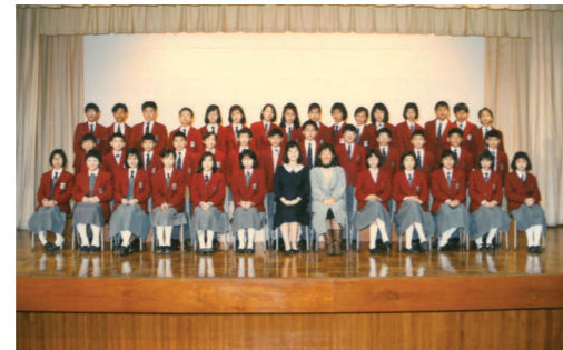
何老師最後一屆做中一班主任 (87-88 S.1A)