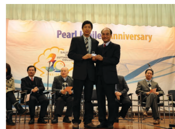
30周年長期服務嘉許(2013年)