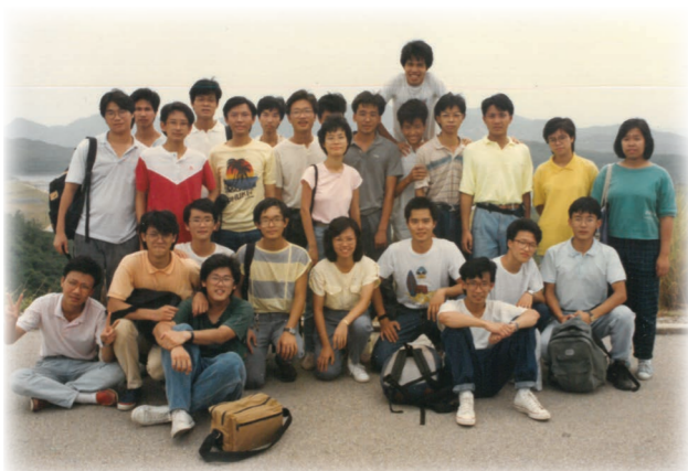
87-88年何老師的第一屆A Level學生