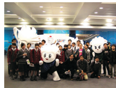
2009年與學生觀看東亞運動會