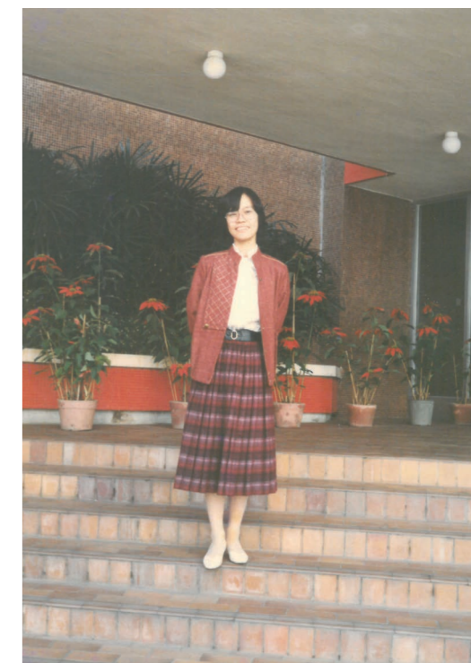
早年在學校舊大門石階前留影