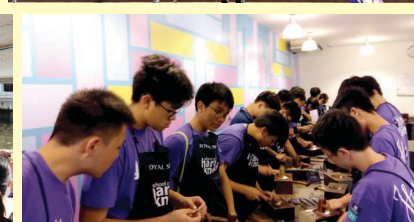
▲ 廣州孫中山事蹟及辛亥革命歷程探索之旅