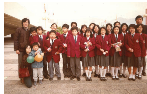
84年與F.1E 學生往紅磧體育館參加佈道會