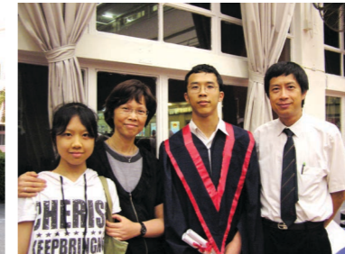
兒子畢業在沐恩合照