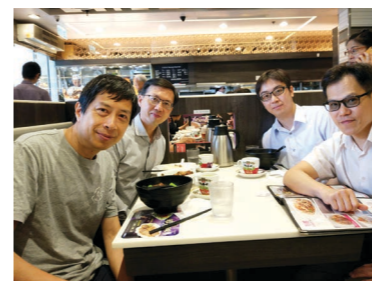
沐恩的物理科老師