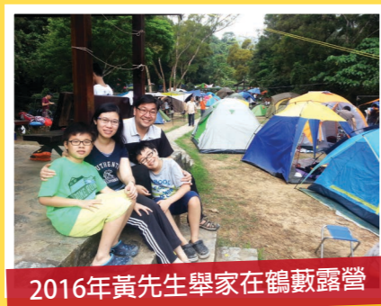
2016年黃先生舉家在鶴藪露營