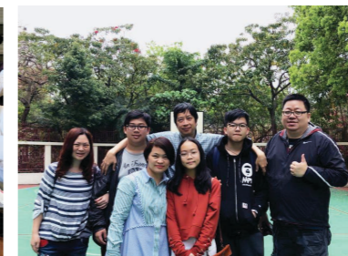
舊生和他們的兒女