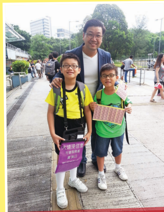
2015年與兩個兒子協助教會賣旗