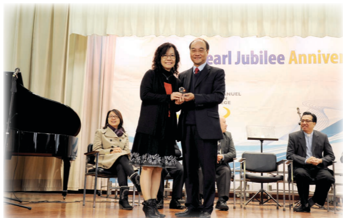
30周年長期服務嘉許 (2013年)