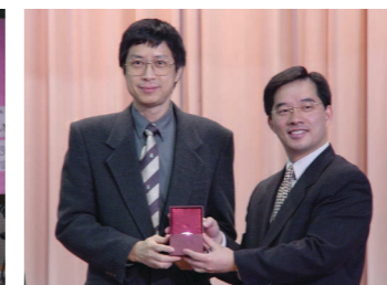
20周年長期服務嘉許(2003年)