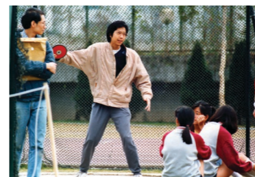
示範符合物理定律的擲鐵餅動作