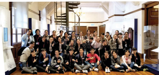
Mr. Work 勞作室—模擬工作世界