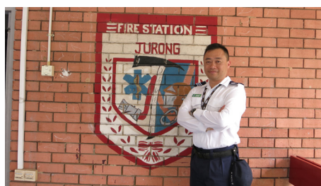
2017年新加坡工作交流課程