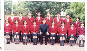
鍾校友當選學生會會長與老師及幹事合照