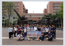
企業策劃學會年宵攤位