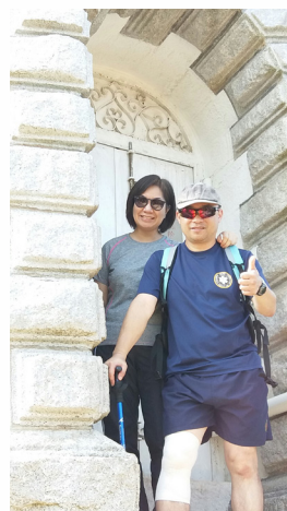
與太太鶴咀遠足行