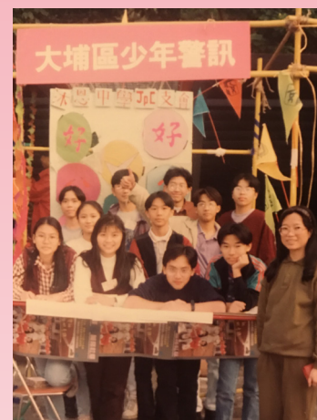
黃校友與當年沐恩少訊支部同工合照

現時不少學生都過於重視學業，以致把其他事情擱置一旁，對此，黃校友坦言學業雖然重要，但絕不是生命的全部，因成績彪炳也不見得成就卓越。那如何兼顧學業及其他工作？黃校友認為關鍵是時間管理。回想當年，她雖然放棄了娛樂以應付少訊的工作，可是她卻很享受籌備活動的時間，因為對她而言，這是她和朋友相處的時間，籌辦社會活動增加了他們的共同話題。能與這一班朋友一同成長，一同經歷，是最美好不過的事。