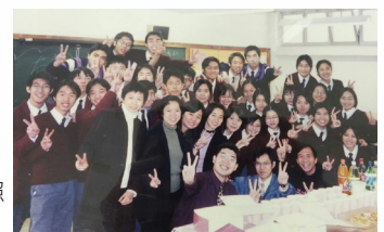
鍾校友與任教老師及同學合照

年輕人前進的動力是對所有新奇事物都有求知慾，應該不恥下問，千萬不要被公開試或學習壓力磨滅。除透過學校學習知識，更可以透過網上接觸不同資訊，相比以前實在容易得多，所以大家應該嘗試接觸更多新事物，學習更多不同知識。你便會體會學而後知不足的道理。還有，千萬不要認為學習是單向，只為完成父母和老師期望。考試並不能代表人生，學業成績固然緊要，但人生成敗不在一時。21世紀講求創意、創新，傳統的影響力或會下降，地產、金融也可能會式微。因此，日後踏入社會，大家可以多嘗試不同的工作，年輕人還有空間和時間，非主流工種也值得一試。