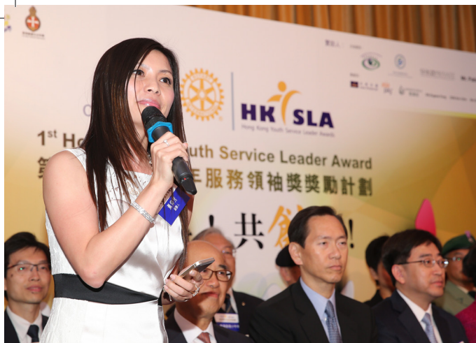
黃校友在第一屆香港青年服務領袖獎頒獎計劃頒獎禮上致詞