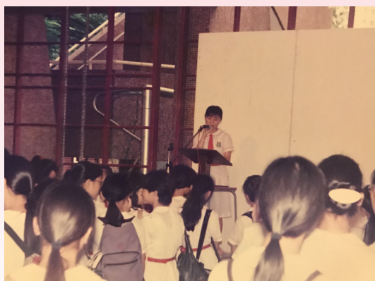
黃校友當年在早會上分享