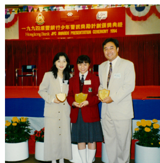
黃校友榮獲當年匯豐銀行少訊獎勵計劃大獎

黃校友指，公益活動對青少年有數不盡的好處，除了提升溝通、領導技巧外，助人時更能獲得滿足感。結識有正能量的朋友，與他們一起同行、成長，將有助自己全面成長。她指出，我們既接受了義務教育，就應肩負起社會責任，而投入公益活動正是回饋社會的一種方法。「不一定要在畢業後才能幫助別人，就算你只是一位學生，也能夠幫助別人。」能讓服務精神薪火相傳，是黃校友最大的心願。