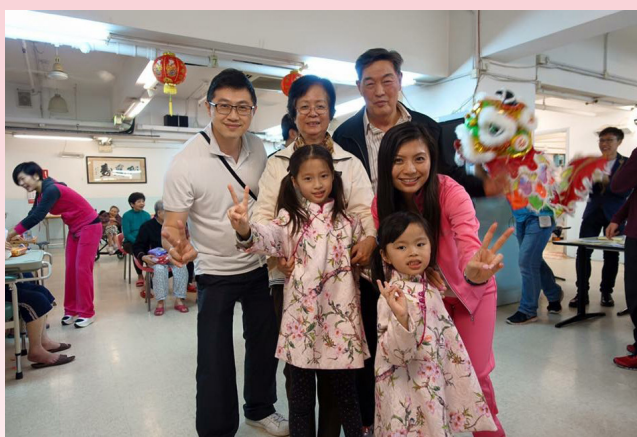
黃校友與家人一起參與公益活動

既要籌備活動，又要兼顧學業，與家人相處的時間會否隨之而減？黃校友笑言開始投身公益活動時，家人曾有微言。但她沒有放棄，繼續專注投入，盡力平衡學習與活動，終獲家人支持。如今，她會帶同家人一同參與社會服務，讓他們接觸有需要的人，體會自己那份助人的滿足感，同時實踐不計較、樂意犧牲的精神。