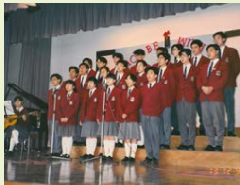
照片由上而下： 當年基督徒詩班/ 與同學老師合照/ 教師退修會活動