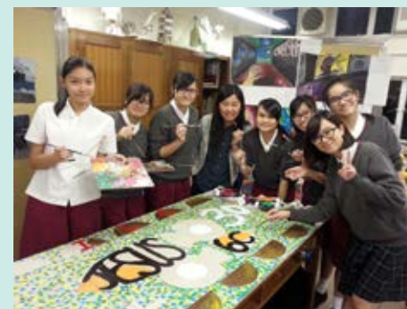
▲ 各班創作一幅地磚畫