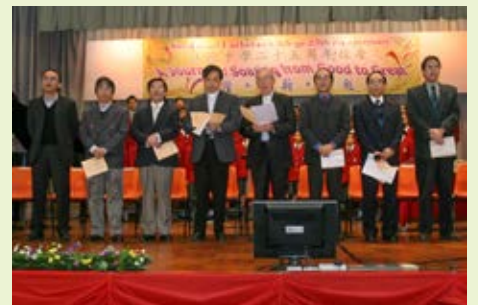
▲ 二十五周年感恩崇拜