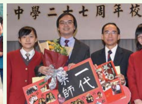
▲接受長期服務獎及學生祝賀