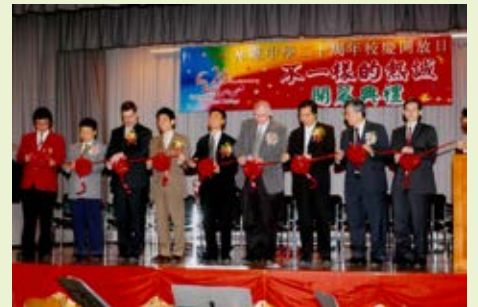
▲ 十五周年開放日剪綵禮