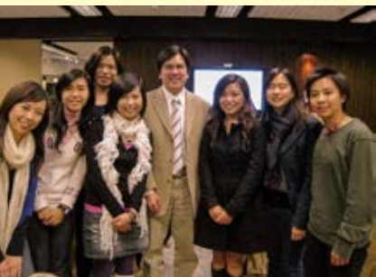
▲25周年聚餐與校友合照