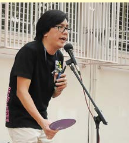
▲在指導同學30周年砌字活動