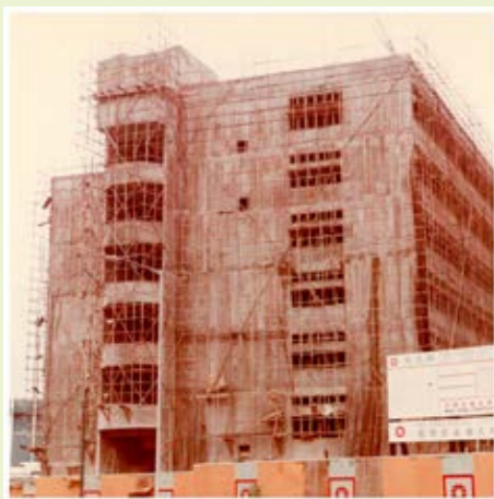
▲ 校舍仍在興建階段