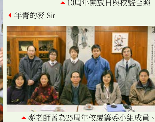
▲麥老師曾為25周年校慶籌委小組成員。