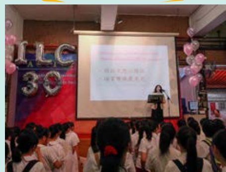
▲ 黃校長主持校慶活動啓動禮