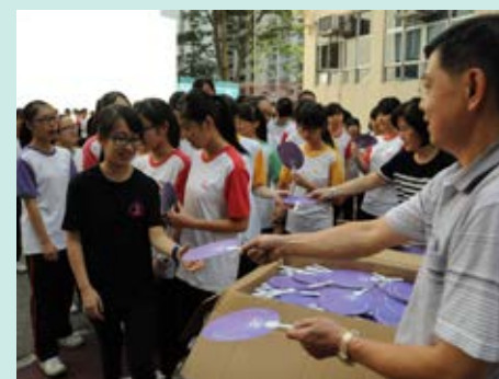
▲ 砌字前先領取需用小道具