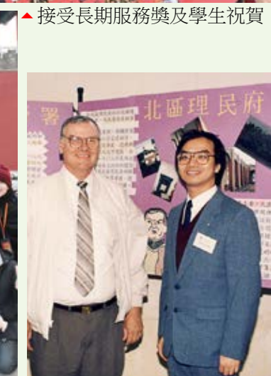
▲10周年開放日與校監合照