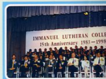
十五周年校慶開幕典禮