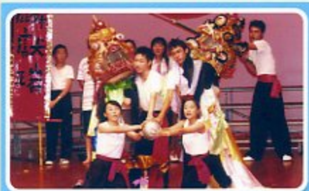
綜藝晚會學生表現