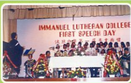
第一屆畢業典禮，詩班獻唱