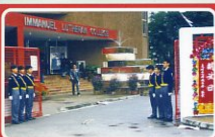
開放日之校園大門。當年階梯前擺放了美術科的裝置藝術作品