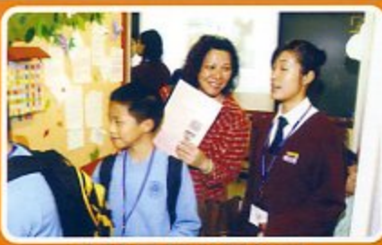
本校同學在開放日當值，向參觀人士講解