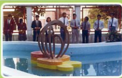
由師生員工合力開發的魚池落成剪綵