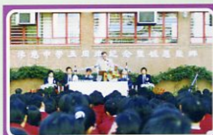
五周年校慶感恩崇拜