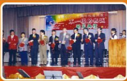
二十周年校慶開幕典禮