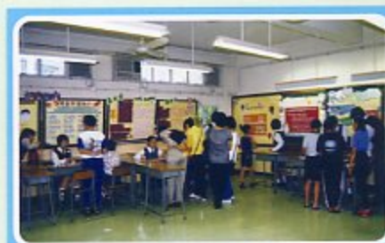
開放日攤位遊戲一角