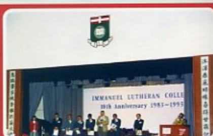
十周年校慶開幕典禮