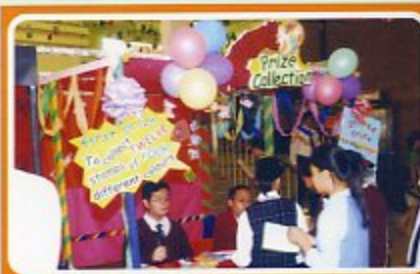
開放日攤位遊戲頒獎處