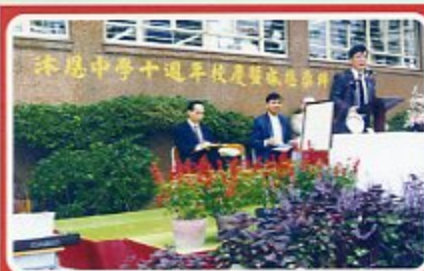
十周年校慶感恩崇拜