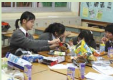
本文描述的零食會議