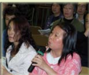
與孩子一起 迎戰會考 中五家長晚會 2007-2-14