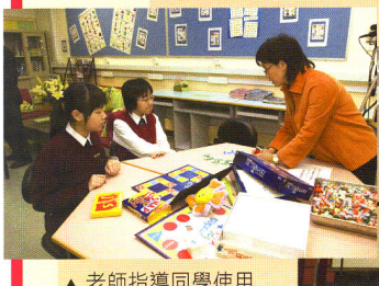
▲ 老師指導同學使用中心設施

英文週其餘活動有英文歌曲點唱，英文謎語競猜，學生佳作展示等等。此外，三月二十四日的早會時間，由幾位中一級同學以英語主領。他們很勇敢地站在全校師長同學面前，以英語介紹了兩位傑出電影工作者李安先生和周星馳先生，然後跟台下同學玩有獎問答遊戲呢！