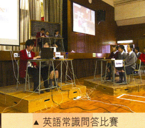
▲ 英語常識問答比賽