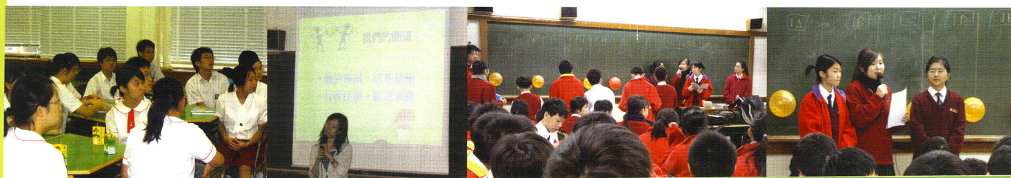
▲ Peer Mentor 聚會情形