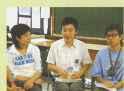
▲ 校友(右)和高年級同學與校園記者交流經驗