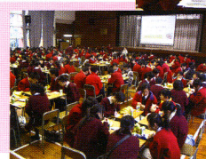
同學支持健康早餐，踴躍參加