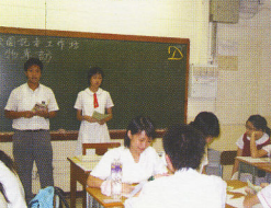
▲ 校友(右)和高年級同學與校園記者交流經驗