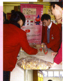
健康大使同學在預備水果午餐