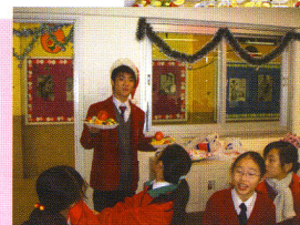
聖誕串燒果籃活動