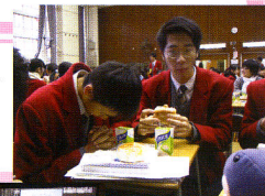
健康早餐， 勿忘謝禮

出任健康大使已經大半年了，究竟有什麼期望寄予給下一屆健康大使呢？「我當然希望可以繼續舉辦健康早餐、午間水果這些對同學有益的活動。而且我覺得他們應該多做義工，因為做義工真的有益身心。」