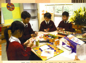
▲ 同學在中心內既遊戲亦學習