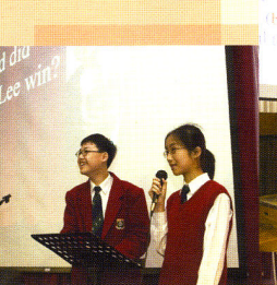
▲ 中一同學主領早會節目