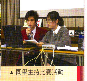
▲ 同學主持比賽活動