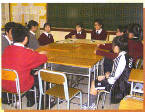
校園記者 召開座談會