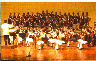
▲ 中樂團合唱團聯合表演