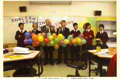
▲ 英語學習中心開幕剪綵

另外，校方今年把三樓的電腦室改建為English Learning Centre(「英語學習中心」)。我們期望同學能善用該處的英文遊戲、英語學習電腦軟件、英語雜誌、英語電影、歌曲等媒介把英語學好。除了這些自學的機會，英語老師還會定期協助同學的英文寫作和播放電影等。我們期望英語學習中心輕鬆的環境能幫助同學，克服講英語的恐懼。