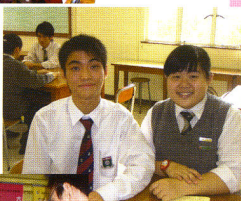
校園記者(右)與接受訪問同學合照